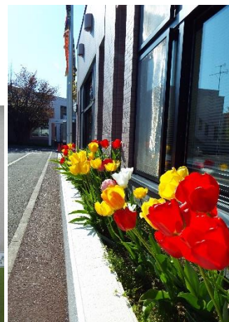
咲き誇るチューリップ