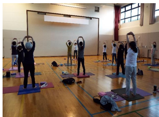
ヨガ健康体操講座 II から