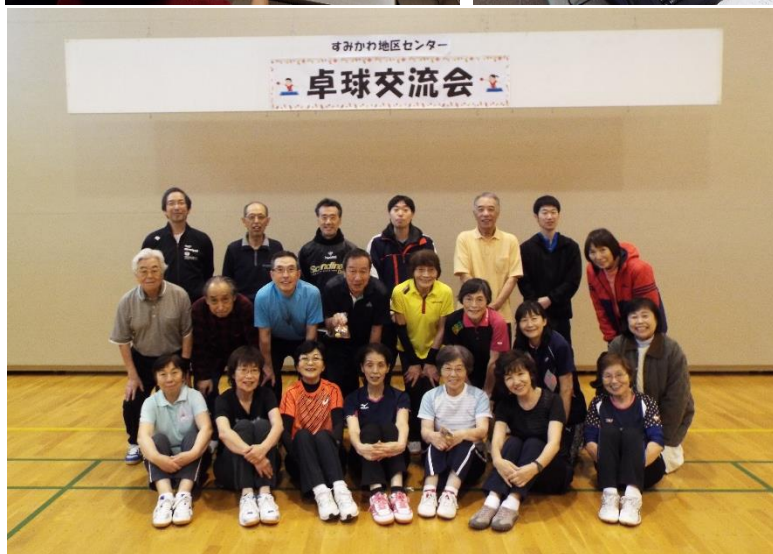
卓球交流会 11/8 から